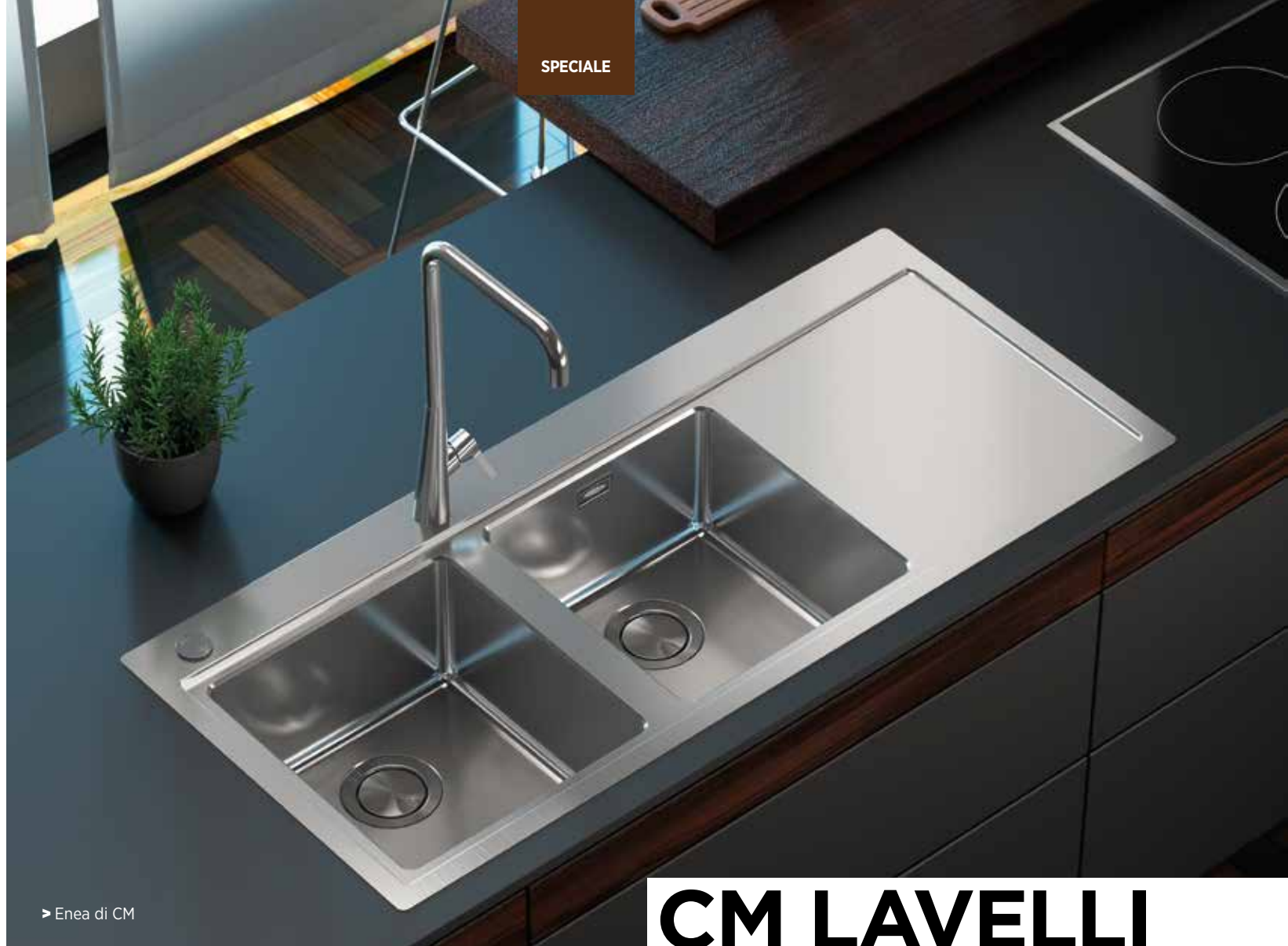
► Enea di CM