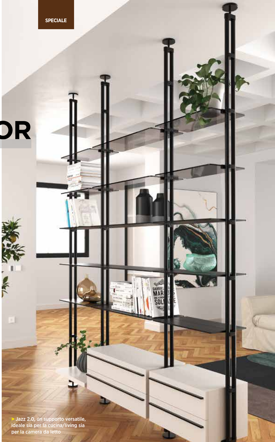
► Jazz 2.0, un supporto versatile, ideale sia per la cucina/living sia per la camera da letto

Tra le ultime proposte e novità, c'è Line 03, una boiserie orizzontale perfetta per organizzare gli spazi e portare praticità ed eleganza in cucina o nel living. Dispone di un Led integrato e accessori modulari e personalizzabili. Alubox, invece, si integra perfettamente con le altre basi per cucina e, soprattutto, non teme l'acqua. Realizzata interamente in alluminio e disponibile anche per composizioni outdoor, è altamente sorprendente e personalizzabile.